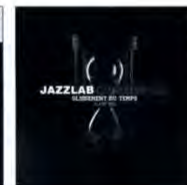
(C) Glissement Du Temps (Slip of Time) / JazzLab Orchestra (Effendi Records FND176)

Le JazzLab Orchestra de Montréal, un ensemble de jazz contemporain de premier plan au Canada, célèbre son 20e anniversaire avec un album réunissant non seulement les membres du collectif, mais aussi d'éminents compositeurs de la scène jazz contemporaine canadienne et internationale, dont François Bourassa, Gentiane MG et Pierre de Bethmann. Dans cet opus, chaque pièce se déploie et se transforme au fil du temps, comme une respiration. Les rythmes complexes et les timbres orchestraux s'entremêlent avec fluidité, créant un voyage sensoriel où le temps devient musique et la musique se transforme en souvenir.