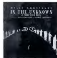
(A) In The Unknown (I Will Find You) / Willy Rodriguez (Sunside Communications, Inc. SSC1797)

モントリオールを拠点に、カナダのコンテンポラリー・ジャズ・ラーズ・アンサンブルをリードするジャズラボ・オーケストラの結成20周年記念アルバムは、このコレクティブのメンバーに加え、フランソワ・ブーラッサ、ジャンティアヌ・エムジー、ビエール・ド・ベトマンらの内外の現代ジャズ・シーンを代表する作曲家をフィーチャーしている。本作では、それぞれの楽曲が一つの呼吸のように、時間の中で移ろい、変化していく。緻密なリズムとオーケストラ的な音色が流動的に織り重なり、時間が音楽となり、音楽が記憶へと変容するような感覚的な旅がここにある (C)。(常盤武彦)