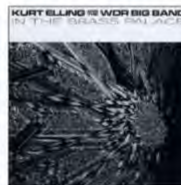
(B) In The Brass Palace / Kurt Elling And the WDR Big Band (Big Shoulders Records BSR0226CD)