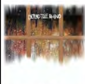
Defend The Things